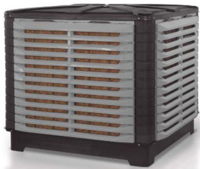
Figura 2 – Exemplo ilustrativo de climatizador evaporativo e acessório (teto).