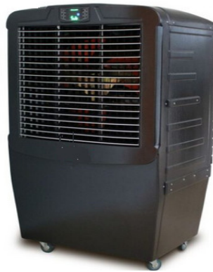
Figura 4 – Exemplo ilustrativo de climatizador evaporativo móvel.